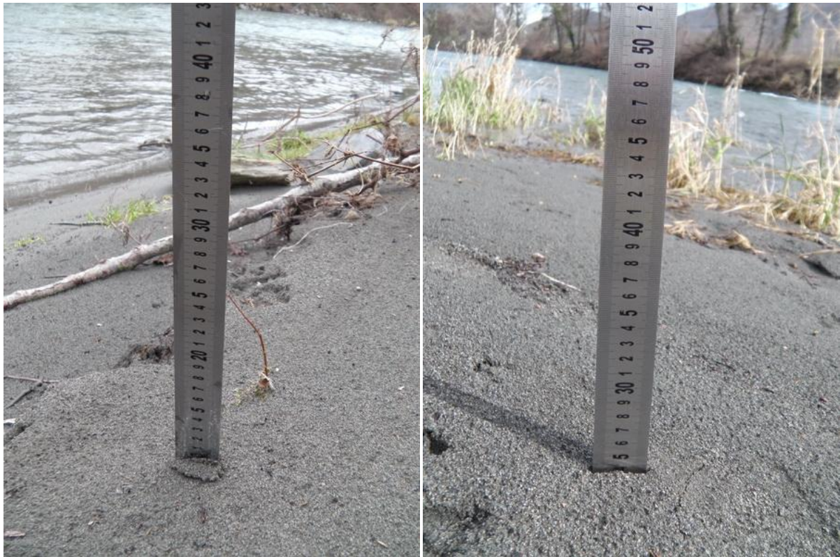
Photos aval de la réserve chaussée de Fronsac le 08/03/18